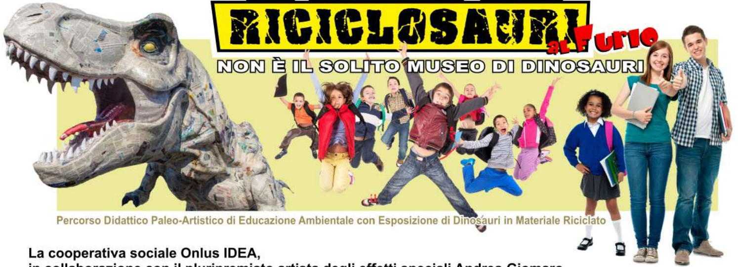
Percorso Didattico Paleo-Artistico di Educazione Ambientale con Esposizione di Dinosauri in Materiale Riciclato

La cooperativa sociale Onlus IDEA, in collaborazione con il pluripremiato artista degli effetti speciali Andrea Giomaro presenta il MUSEO DEI RICCLOSURI al Furlo.